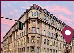
Bundesministerium für Gesundheit